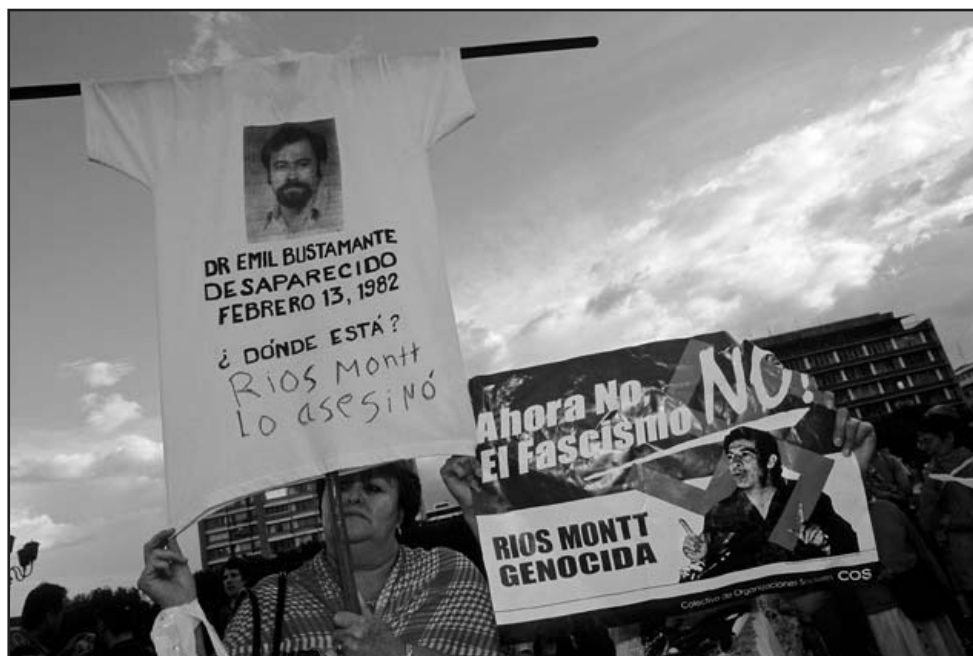
Guatemala. Archivo fotográfica.

En una investigación que estamos realizando en Guatemala con la idea de monitorizar el impacto de las exhumaciones y analizar los factores con los que éstas están vinculadas, desde la perspectiva de las personas de las comunidades, al preguntar sobre cómo se debería actuar con las personas que masacraron en la violencia política, la mitad estuvo de acuerdo que se debía actuar a través de la Justicia Oficial. Para el resto, la justicia