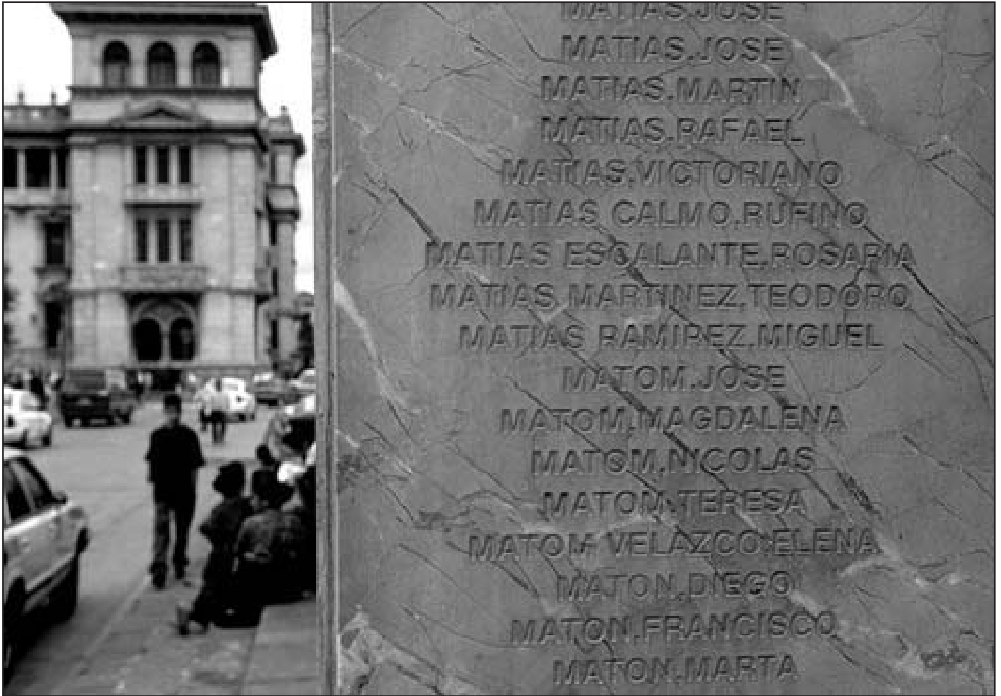
Guatemala. Archivo fotográfica.

Existen posicionamientos desde las víctimas y familiares que matizan la realización de las exhumaciones, uno de estos casos son las Madres de la Plaza de Mayo de Argentina: