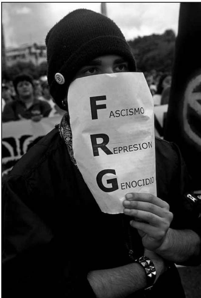
Guatemala. Archivo fotográfica.

Si no nos damos cuenta de esto podemos caer en plantear que con lo que tiene problemas la población es con sus sentimientos y no con el contexto agresor.