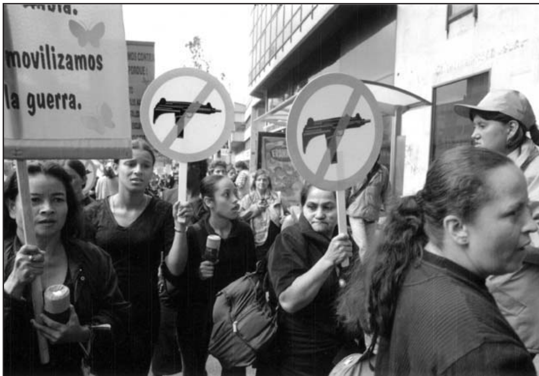
Foto: Donna de Cesare. Colombia: Imágenes y Realidades. Archivo FDM-OACNUDH

lativa al delito de la desaparición forzada de personas. Ésta constituye uno de los más graves crímenes que recurrentemente enfrenta la humanidad. Se trata de un delito que viola normas destinadas a garantizar la vigencia de los derechos humanos, cuya observancia constituye obligación para los Estados. Este fenómeno criminal, de larga tradición en América Latina, muestra por desgracia hoy a Colombia como uno de los países donde su expresión es más grave, pese a lo complejo de su dimensionamiento. Los registros de la Asociación de Familiares de Detenidos Desaparecidos -ASFADDES hablan de más de 7000 colombianos desaparecidos. El país ha venido, durante los últimos meses corriendo de forma tímida el velo para dejar entrever algo que se intuye más grave de lo que hasta ahora parece y que guarda una relación cercana con la desaparición forzada, pero que nos pone de plano en un asunto que resulta central, como es el de las exhumaciones.