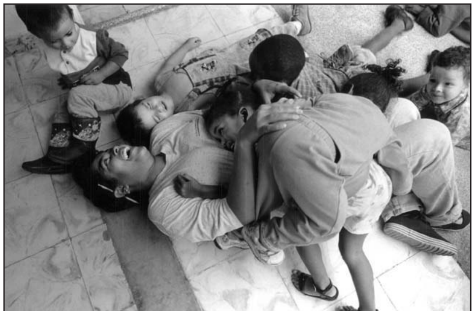
Foto: Donna De Cesare. Colombia: Imágenes y Realidades . Archivo FDM-OACNUDH

Sin embargo, esto no significa que hay una sola verdad y que contarla garantizará la reconciliación y la paz. Es el proceso de la búsqueda de la verdad lo que es importante. Yo no estoy abogando necesariamente por que una comisión de la verdad sea el mejor mecanismo para esta búsqueda, pero los hechos generalmente abordados por las comisiones de la verdad –como tratar de re-evaluar e investigar las causas, naturaleza y extensión del conflicto–, son consideraciones esenciales en relación con el conflicto. El primer paso es reconocer la importancia de buscar algún tipo de verdad y embar-