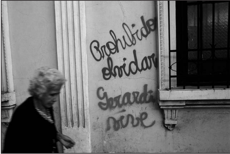
Guatemala. Archivo fotográfica.