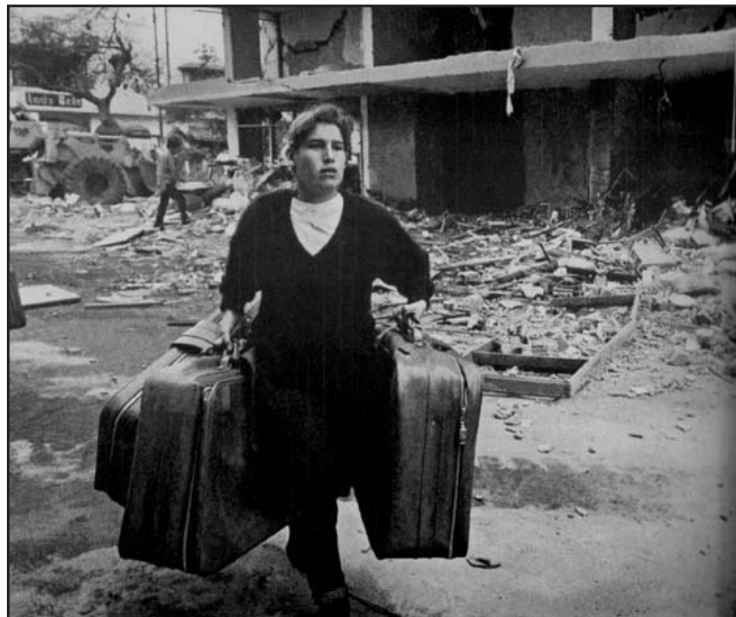
Exposición de la Comisión de la Verdad y Reconciliación. Perú

Desde que el individuo se forja en diálogo sostenido con el entorno social, del que emerge y al que a su vez configura, aportando sus vivencias, representaciones, fantasías, acciones, el efecto de la violencia política es multidimensional. En lo individual devasta cuerpos y mentes, en lo social desarticula los vínculos, los presupuestos de seguridad garantes de la construcción de una historia colectiva coherente, en proceso de perpetua elaboración. Tanto a nivel individual como colectivo los sentidos y modos de afrontamiento normales son sobrepasados por la intensidad del trauma y mecanismos de adaptación de emergencia entran en juego pero el procesamiento de lo vivido, lo visto, lo sentido, suponen una rearticulación forzada (y muchas veces distorsionada) de los referentes en los que los individuos y grupos apoyan su identidad. El tiempo y las imágenes "se congelan", reverberan sobre las representaciones en la vivencia de la historia previa al hecho disruptivo y en la proyección (o falta de ella) hacia el futuro.