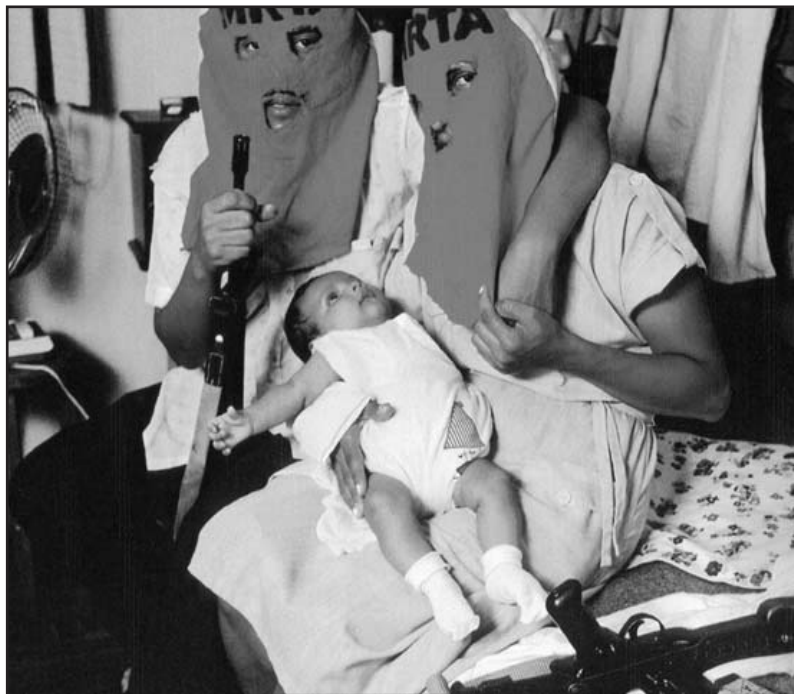
Exposición de la Comisión de la Verdad y Reconciliación. Perú

Vemos que una actitud asistencialista no favorece una auténtica reparación y por el contrario ancla al afectado en el rol de víctima. Reestructurar, revalorar y dinamizar los recursos individuales y colectivos son tareas de una sociedad afectada por la violencia política. La magnitud de