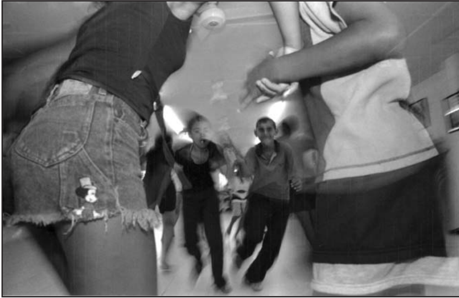
Foto: Donna de Cesare. Colombia: Imágenes y Realidades . Archivo FDM-OACNUDH

les fundamentales en una sociedad, más aún cuando estas heridas fueron permitidas y son frecuentemente justificadas por los perpetradores y otros individuos de la sociedad. En los niveles individual y social, "donde las violaciones flagrantes a los derechos humanos ocurren, la confianza, el sentido de pertenencia, el sentido de auto gestión y control –y por ende en sentido de construcción–, está destruido o seriamente afectado" 5